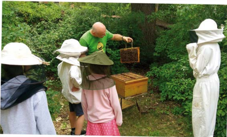
Willst du Gottes Wunder sehen, musst du zu den Bienen gehen - Kinderferientage