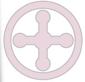
Gipfelstürmer - Familienfreizeit in Österreich